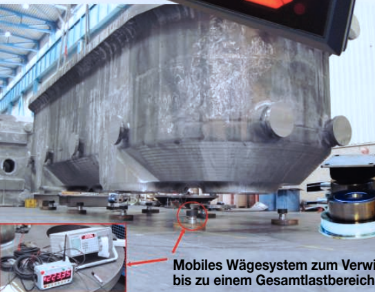
Mobiles Wägesystem zum Verwiegen von Objekten bis zu einem Gesamtlastbereich von 600 t, auch zur Vermietung möglich.