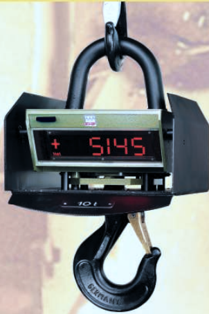
Digital-Kranwaage KGW 1...100 ton für den Einsatz in heißen Umgebungstemperaturen wie Schmelzbetrieb und extrem robuste Anwendungen