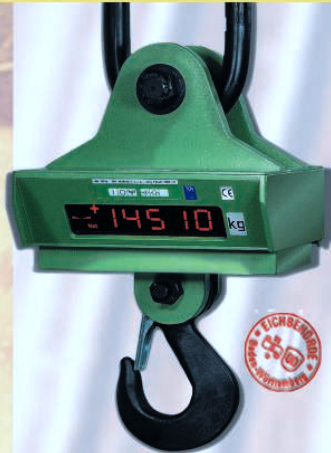
Extrem robuste, eichfähige Digital-Kranwaage KGY Wägebereich 1-100.000 kg