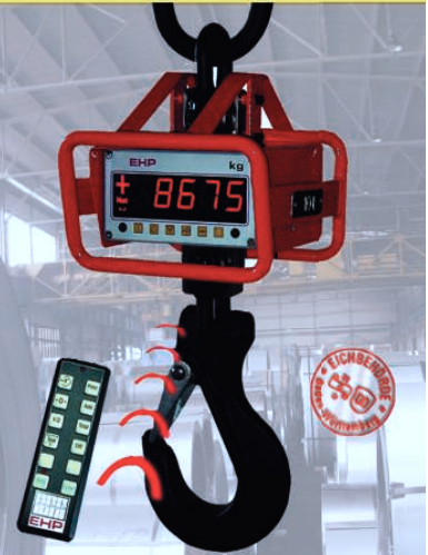
LD/LDN Digital-Kranwaage eichfähig, für den industriellen Einsatz