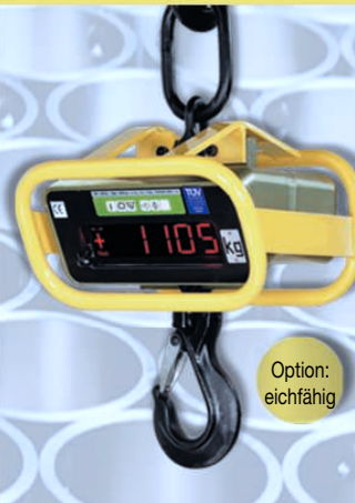
Digital-Kranwaage LK/LKe für rauhe, industrielle Einsatzbedingungen