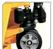
Langlebige, wartungsfreie Hydraulikpumpe mit verchromten Druckkolben